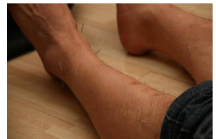
Les points d'acupuncture sont situés à des endroits très spécifiques sur le corps. 2

Les aiguilles d'acupuncture sont minces, stériles et à usage unique. Elles sont solides et ne peuvent pas être utilisées pour injecter ou prélever des fluides du corps. Les aiguilles sont insérées dans la peau à des endroits nommés points d'acupuncture. Les points d'acupuncture sont des points spécifiques sur le corps qui sont considérés comme ayant une influence sur les différents systèmes du corps. Quand les aiguilles sont insérées dans la peau, elles peuvent causer une douleur minimale et/ou des saignements.