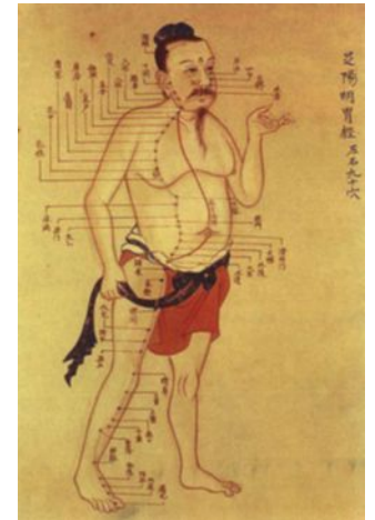
Illustration ancienne de l'acupuncture méridienne basée sur la médecine chinoise traditionnelle. 3

La médecine chinoise traditionnelle est basée sur la croyance qu'une maladie se déclare chez une personne dont le flux d'énergie dans le corps est déséquilibré. Ce flux d'énergie est connu sous le nom de Qi (prononcé chi ) et est considéré comme circulant le long des lignes d'énergie dans le corps nommées méridiennes. Les points d'acupuncture traditionnelle sont situés aux endroits où ces lignes circuleraient près de la surface de la peau. Ainsi, en stimulant ces points d'acupuncture avec des aiguilles, cela favoriserait l'équilibre de l'énergie du corps et traiterait ainsi les conditions de santé.