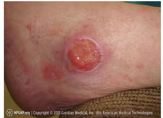
Plaie de pression sur le côté de la cheville. 2

La cartographie de pression peut être utilisée comme outil pour faciliter la prise de décision lorsqu'on sélectionne les surfaces de support et l'équipement, comme en évaluant quels coussins de fauteuil roulant fournissent le meilleur relâchement de pression pour vous. La cartographie de pression est aussi utilisée pour évaluer l'efficacité des techniques de relâchement de pression comme le transfert de poids en fournissant une rétroaction en temps réel de la pression durant la réalisation de ces techniques.