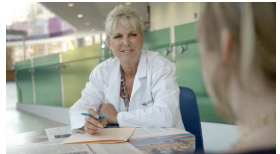
Travailler avec une clinicienne en santé sexuelle peut faire partie de la réadaptation. 6

La santé sexuelle et reproductive est une partie importante de la santé. Consulter avec des cliniciens en santé sexuelle peut être une partie importante de la réadaptation après une LME.