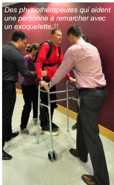
Des physiothérapeutes qui aident une personne à remarcher avec un exoqueuelette. 11

Les ergothérapeutes aident les personnes à atteindre leurs objectifs concernant la vie quotidienne et les activités fonctionnelles. Les ergothérapeutes travaillent avec les personnes pour développer des techniques pour les tâches quotidiennes comme se laver, s'habiller et se nourrir. Ils évaluent aussi la sécurité et l'accessibilité des espaces de vie et prescrivent des équipements comme des fauteuils roulants et des attelles.