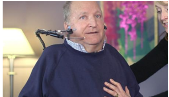
Certaines personnes ayant une LME ont besoin d'aide pour respirer et tousser. 5

Les soins respiratoires peuvent inclure des exercices de respiration et de toux, des soins pour les infections aux poumons et l'apprentissage de l'utilisation d'équipement et la gestion de la respiration suite à la réadaptation.