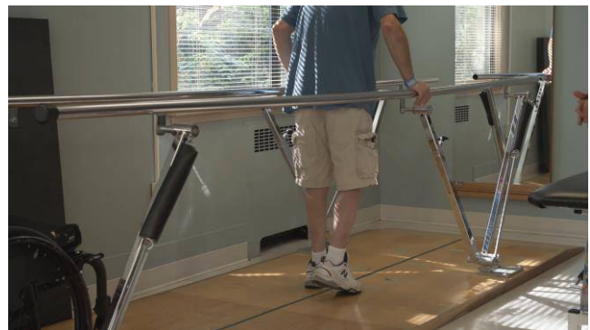
Une partie de la réadaptation peut être axée sur le développement des habiletés de mobilité, comme marcher ou utiliser un fauteuil roulant. 1

La réadaptation est adaptée aux besoins uniques de chaque personne. Elle peut impliquer des soins médicaux et infirmiers, des thérapies de réadaptation (telles que physiothérapie, ergothérapie ou thérapie respiratoire) et plusieurs autres services de santé pour faciliter la transition de l'hôpital à la communauté.