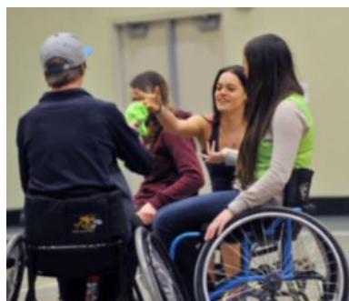
Les pairs mentors peuvent offrir du support émotionnel et des conseils pratiques pour vivre avec une LME. 12

Les travailleurs sociaux se spécialisent pour fournir des ressources communautaires, du support et des conseils liés au rétablissement des troubles mentaux et peuvent aider à planifier les soins après l'hospitalisation.