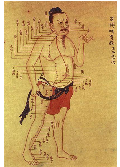
Illustration ancienne de l'acupuncture méridienne basée sur la médecine chinoise traditionnelle. 3

La médecine chinoise traditionnelle est basée sur la croyance qu'une maladie se déclare chez une personne dont le flux d'énergie dans le corps est déséquilibré. Ce flux d'énergie est connu sous le nom de Qi (prononcé «chi») et est considéré comme circulant le long des lignes d'énergie dans le corps nommées méridiennes. Les points d'acupuncture traditionnelle sont situés aux endroits où ces lignes circuleraient près de la surface de la peau. Ainsi, en stimulant ces points d'acupuncture avec des aiguilles, cela favoriserait l'équilibre de l'énergie du corps et traiterait ainsi les conditions de santé.