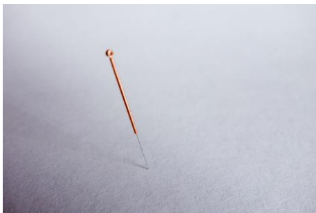
Les aiguilles d'acupuncture sont de minces aiguilles qui sont insérées dans les points d'acupuncture du corps. 1

L'acupuncture est une pratique médicale complémentaire et alternative utilisée depuis des milliers d'années dans la médecine chinoise traditionnelle. L'acupuncture consiste en l'insertion de petites aiguilles très fines dans des endroits spécifiques du corps, qui sont appelés points d'acupuncture.