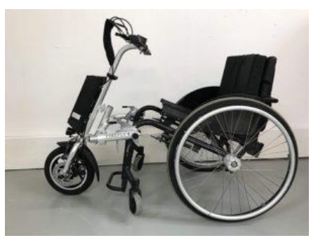
Η χρήση μιας συσκευής υποβοήθησης ώθησης μπορεί να εξαλείψει την επιβάρυνση των χεριών.<sup>6</sup>

αμαξιδίου, η χρήση ενός πρόσθετου με ηλεκτρική υποβοήθηση ή η προσθήκη ενός εμπρόσθιου τροφοδοτούμενου συστήματος μπορεί να μειώσει σημαντικά τη χρήση των ώμων.