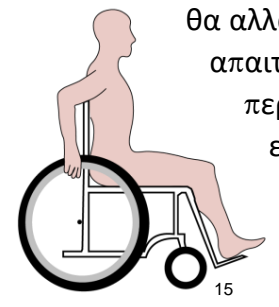
Τροχοί σε πρόσθια θέση Τροχοί σε οπίσθια θέση

θα αλλάξουν τον τρόπο με τον οποίο ωθείται το αμαξίδιο και την απαιτούμενη ενέργεια. Ορισμένες πιθανές ρυθμίσεις περιλαμβάνουν τη μετακίνηση του πίσω τροχού προς τα εμπρός για να μειωθεί η απόσταση προσέγγισης από τον τροχό, τη ρύθμιση του ύψους του άξονα του τροχού για τη βελτιστοποίηση της γωνίας αγκώνα σας (μεταξύ 100-120°) και τη γενική συντήρηση αμαξιδίου (π.χ. πίεση ελαστικών, λειτουργίες τροχού) για να διασφαλίσετε ότι παραμένει εύκολο να προωθηθεί.