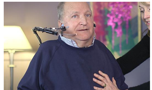
Μερικοί άνθρωποι με ΚΝΜ χρειάζονται βοήθεια με την αναπνοή και το βήχα. 5

Η αναπνευστική φροντίδα μπορεί να περιλαμβάνει ασκήσεις αναπνοής και βήχα, φροντίδα για μολύνσεις των πνευμόνων και την εκπαίδευση στη χρήση εξοπλισμού και την αντιμετώπιση της αναπνοής από τη στιγμή που θα φύγετε από την αποκατάσταση.