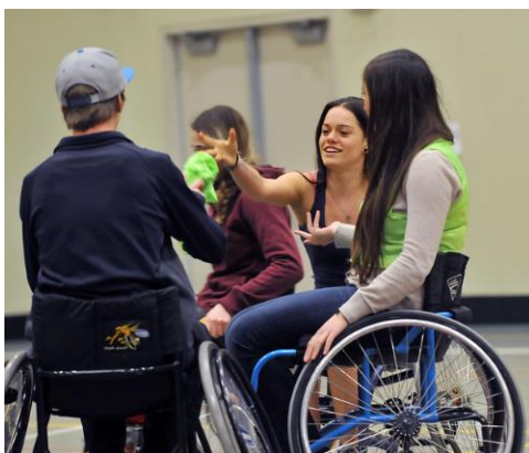
Ομότιμοι μέντορες μπορούν να προσφέρουν συναισθηματική υποστήριξη και πρακτικές συμβουλές για τη ζωή με ΚΝΜ. 12

Οι Κοινωνικοί Λειτουργοί εξειδικεύονται στην παροχή πόρων της κοινότητας, υποστήριξη και συμβουλευτική σε σχέση με την ανάρρωση από ψυχικές διαταραχές και ενδέχεται να συνδράμουν στη διαμόρφωση σχεδίου φροντίδας μετά την έξοδο από το νοσοκομείο.