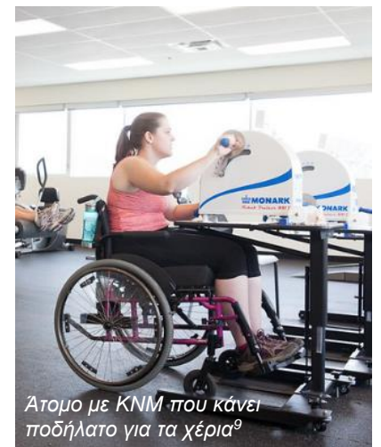
Άτομο με ΚΝΜ που κάνει ποδήλατο για τα χέρια 9

Οι αεροβικές ασκήσεις προπονούν την καρδιά, τους πνεύμονες, το κυκλοφορικό σύστημα μέσω της επανάληψης και της κίνησης για ένα μεγάλο χρονικό διάστημα. Η αεροβική άσκηση είναι πολύ σημαντικό κομμάτι της διατήρησης της καρδιαγγειακής υγείας. Η αεροβική άσκηση στην αποκατάσταση μπορεί να περιλαμβάνει δραστηριότητες όπως ποδήλατο για τα χέρια, ποδηλασία λειτουργικής ηλεκτρικής διέγερσης και υποστήριξη στη βάδιση με τη χρήση παράλληλων μπαρών (δίζυγο) ή με υποστήριξη βάρους σώματος.