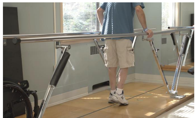
Μέρος της αποκατάστασης μπορεί να εστιάζει στην ανάπτυξη κινητικών δεξιοτήτων, όπως το περπάτημα ή τη χρήση αναπηρικού αμαξιδίου. 1

Φεύγοντας από το νοσοκομείο (φροντίδα οξείας φάσης) μετά την ΚΝΜ, οι περισσότεροι άνθρωποι μεταφέρονται σε ένα κέντρο αποκατάστασης ή μονάδα αποκατάστασης όπου εστιάζουν στην ανάρρωση και στην ανάπτυξη δεξιοτήτων που είναι χρήσιμες μακροπρόθεσμα ζώντας με ΚΝΜ.