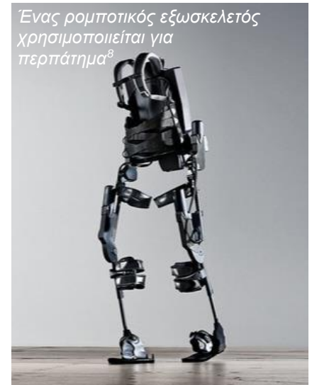
Ένας ρομποτικός εξωσκελετός χρησιμοποιείται για περπάτημα 8

Το περπάτημα μπορεί να εξασκηθεί στην αποκατάσταση. Αυτό μπορεί να περιλαμβάνει μια ποικιλία από διαφορετικές στρατηγικές, που συνήθως εξελίσσεται από την ορθοστάτηση στο βήμα και στο περπάτημα. Μπορεί επίσης να περιλαμβάνει ασκήσεις ενδυνάμωσης, βοηθητικές συσκευές όπως μπαστούνια, περιπατητήρες και παράλληλες μπάρες (δίζυγο) και νάρθηκες και ορθοστάτες. Μερικές μονάδες χρησιμοποιούν ειδικό εξοπλισμό όπως προπόνηση σε διάδρομο με υποστήριξη του σωματικού βάρους και ρομποτικούς εξωσκελετούς.