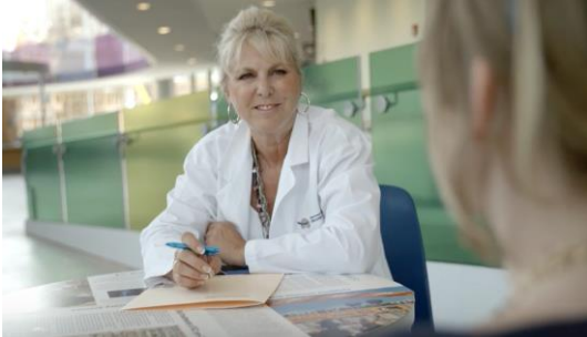
Δουλεύοντας με έναν ειδικό σεξουαλικής υγείας μπορεί να είναι ένα μέρος της αποκατάστασης. 6